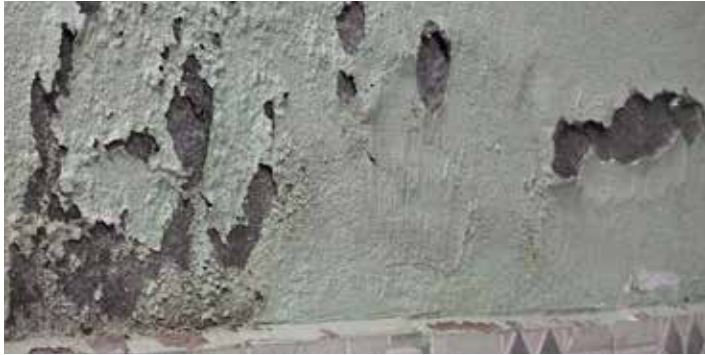
Pred použitím SikaMur® System