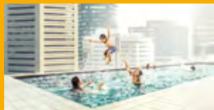
LEPENÍ A TMELENÍ