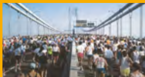
SANACE A OCHRANA BETONU