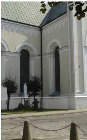
Po aplikácii sanačnej malty budú steny obnovené a chránené.

DAJTE SVOJEJ STENE DÝCHAŤ DOVOĽTE VLHKOSTI VYPARIŤ SA