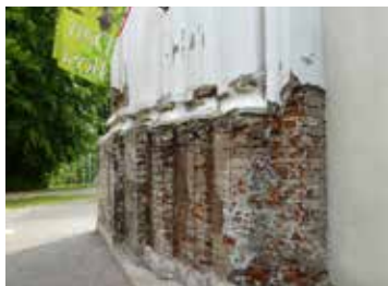
Odstráňte poškodenú omietku.