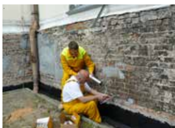
Aplikácia hydroizolačnej bariéry proti vzliňajúcej vlhkosti