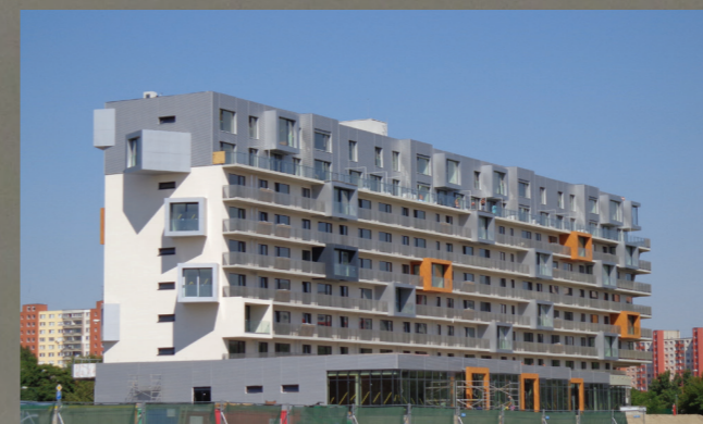
REFERENCIA: Petržalka City, Bratislava Vyrovnávajúci poter Sikafloor® Level-30 s následným farebným epoxidovým náterom Sikafloor®-2530 W