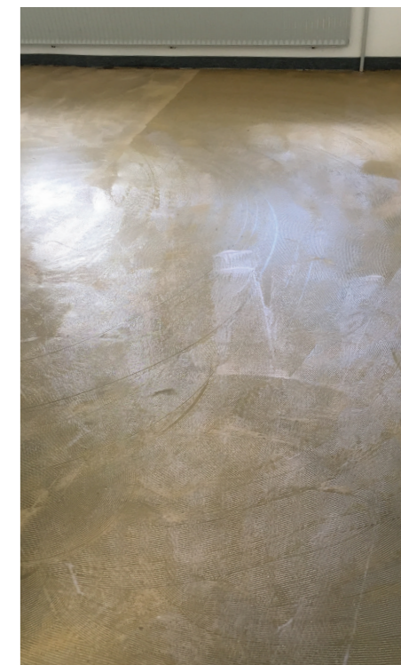
Podklad podlahy pokrytý lepidlom