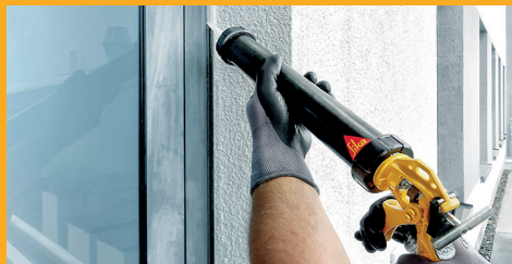
TMELENIE A LEPENIE