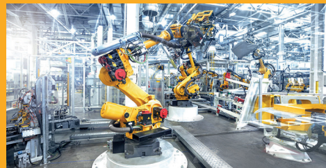
TMELY A LEPIDLÁ PRE PRIEMYSEL