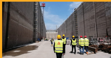
OPRAVA A OCHRANA BETÓNU